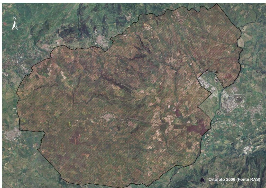
Fig.1 Perimetro della ZPS Alto Piano di Abbasanta

La ZPS Altopiano di Abbasanta è ubicata al centro della Sardegna, fra le pendici della Catena del Marghine e la Media Valle del Tirso, a cavallo fra due Province, quella di Nuoro (80% dell'area) e quella di Oristano (restante 20%); la prima comprende la parte settentrionale e centrale della ZPS mentre la seconda quella più a sud.